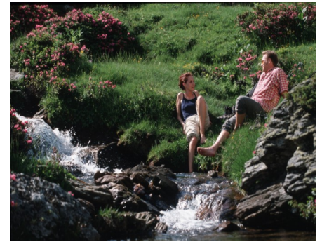
Wanderrast am Gebirgsbach inmitten blühender Almrosen

Gemütlichkeit und familiäre Atmosphäre prägen unser Haus. Gastfreundschaft wird bei uns wörtlich genommen.