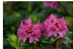
Ein roter Teppich in der Landschaft