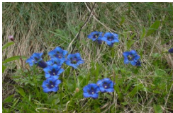
Stängelloser Enzian im Frühling

21.5.11—11.6.11 1 Tag € 55,- 7 Tage € 364,-