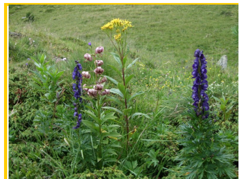
Blumenvielfalt in den Nockbergen

Genießen Sie die Ruhe zum Ende des Bergsommers!