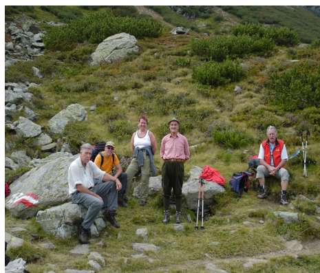
Rast am Weg zum Rosennock

Unser hauseigener Tennisplatz bietet Ihnen Abwechslung zwischen Ihren Wandertagen