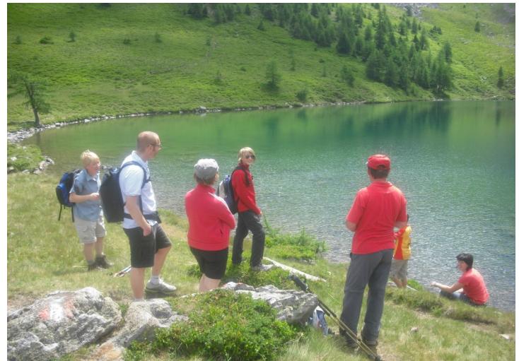
Gemeinsame Wanderung zum Laubnitzsee