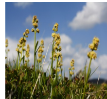
Die Geschichte des Baldriangewächs am Speikweg auf der Blutigen Alm