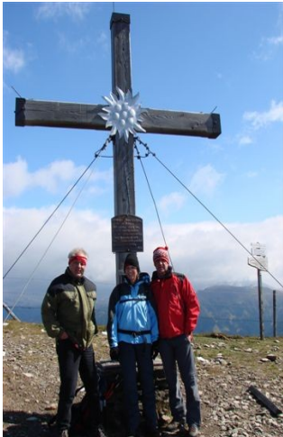
Gipfelwanderung im Spätherbst

Unser Haus hat 30 Gästebetten. Alle Zimmer sind mit Dusche oder Bad, Föhn, WC, Balkon, Tel, TV ausgestattet. Im geschmackvoll eingerichteten Speisesaal, den rustikalen Gasträumen, im Stüberl oder an der Hotelbar treffen sich unsere Gäste bei Geselligkeit und guter Laune. Wir verwöhnen Sie mit lukullischen Genüssen aus Küche und Keller. Für den Pensionsgast gibt es Wahlmenüs, darunter auch fleischlose Speisen, ein Frühstücksbuffet, eine Salatbar und Dessertwahl.